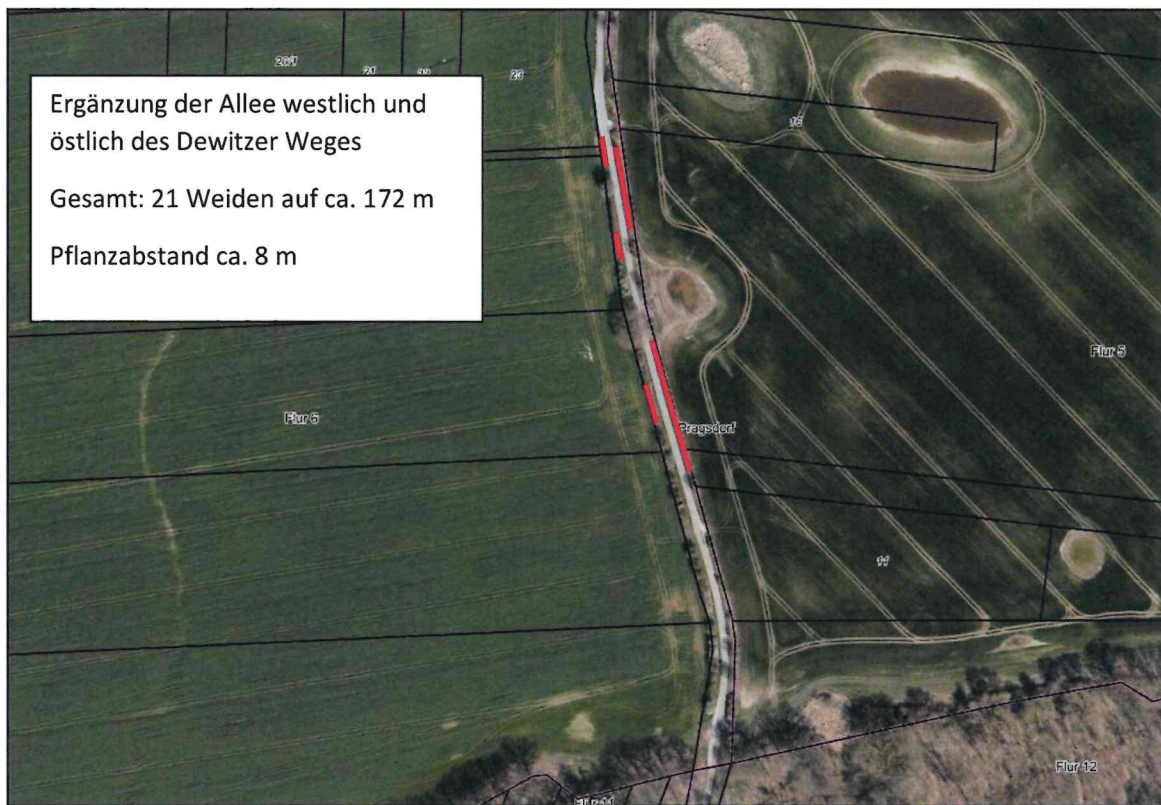
Abbildung 5: Geplante Ergänzung der Allee durch Pflanzung von Weiden (Flurstück 24, Flur 6, Gemarkung Pragsdorf)