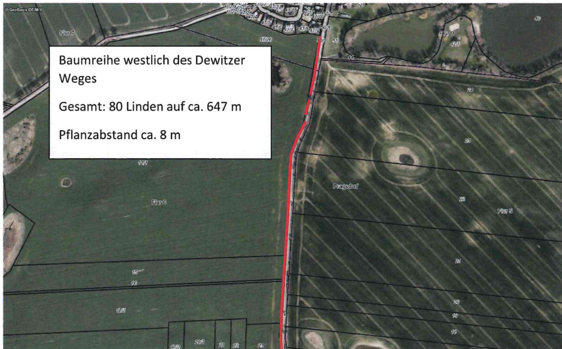
Abbildung 4: Geplante Pflanzung von Linden westlich des Dewitzer Weges (Flurstücke 50/9, 24, Flur 6, Gemarkung Pragsdorf)