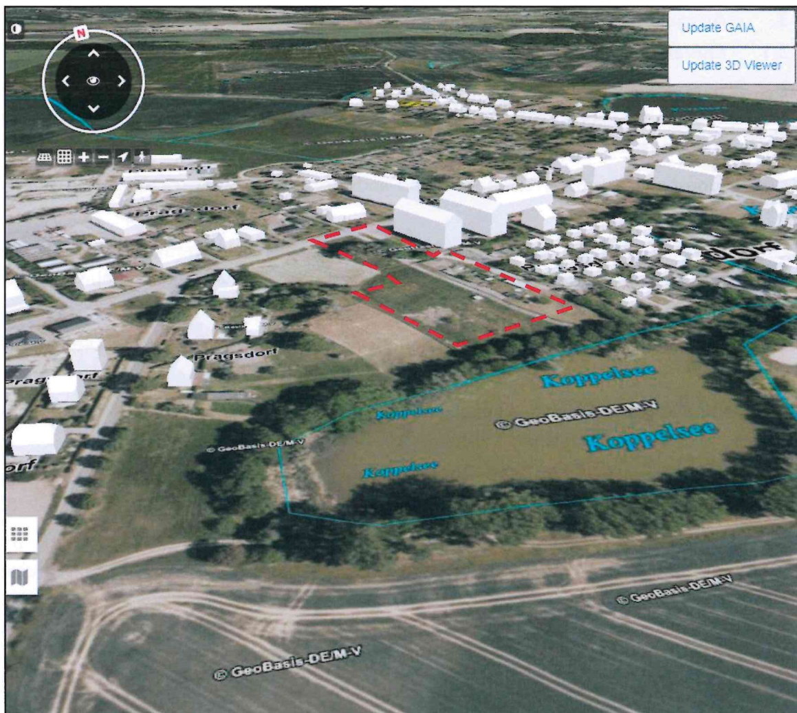
Abbildung 1: Ausschnitt aus der VirtualCityMAP 3D Stadtmodelle (Planungsraum rot markiert)